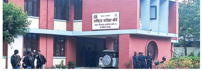
पूरक परीक्षा हुँदैछ। यसअघि, एसईई-

राष्ट्रिय परीक्षा बोर्ड, परीक्षा नियन्त्रण कार्यालयले माध्यमिक शिक्षा परीक्षा (एसईई) को पूरक (ग्रेडवृद्धि) परीक्षा सम्पन्न भएको दुई साताभित्र नतिजा प्रकाशन गर्ने गरी तयारी गरेको छ। आगामी असार १ देखि ९ गतेसम्म