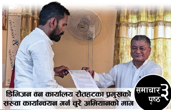
डिजिटल वन कार्यालय रौतहटका प्रमुखको सरुवा कार्यान्वयन गर्न चुरे अभियानको माग